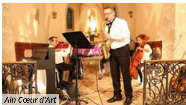
Ain Cœur d'Art