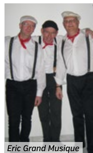
Eric Grand Musique